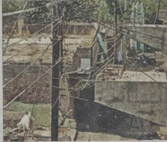
लटकते बिजली के तार और आड़े आ रहे मकानों ने बिजु का काम रोक दिया है।

9 करोड़ रुपए में पड़ेगी देनी, 25 नहीं अब पुल बनने में खर्च होगा 34 करोड़ रुपए