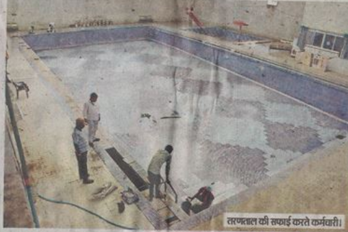
तरणताल की सफाई करते कर्मचारी।