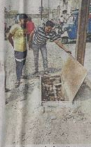
पानी की लाइन के मेन वॉल्व पर भी सीसी वर्क की तैयारी है।